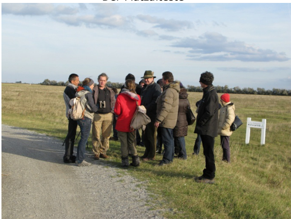
Eine kurze Rast