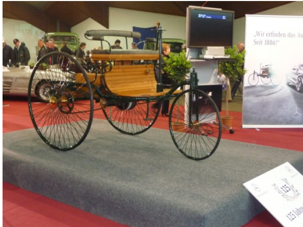
Benz Patent-Motorwagen Modell 1 (Nachbau)

Die heurige Oldtimermesse in Tulln stand ganz im Zeichen des 125 Jahre Automobil – Jubiläums. Aus diesem Anlass hatten wir als Mercedes Benz Classic Club eine ganze Halle zur Verfügung, die wir gemeinsam mit dem SL Club auch bis in den letzten Winkel mit tollen Exponaten füllten.