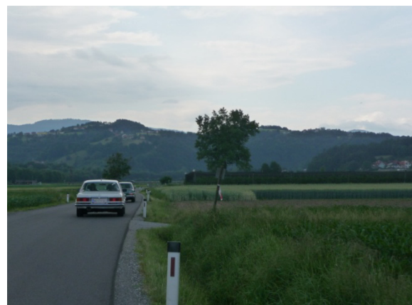
„Auf zur Lurgrotte!“