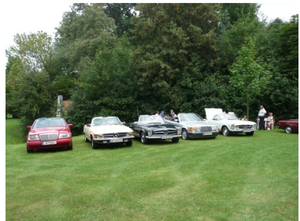
Die „Oben Ohne“ Fraktion