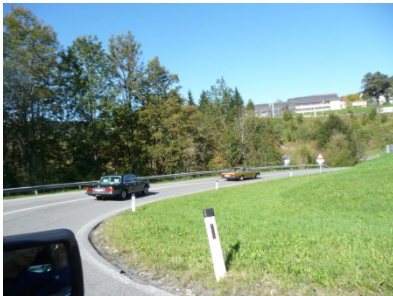
Kurz vor Mariazell