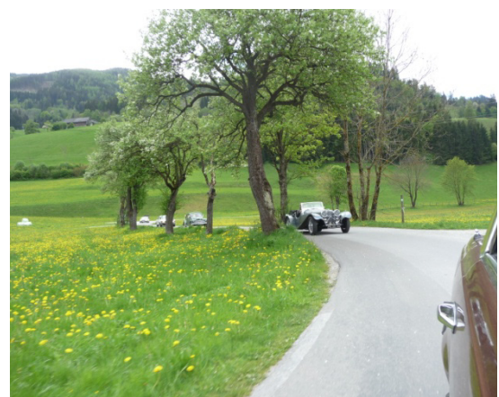
Immer noch trocken

Der kurze Mittagsregen konnte uns diese tolle Ausfahrt nicht verderben, und wir werden noch lange gerne am Stammtisch darüber plaudern.