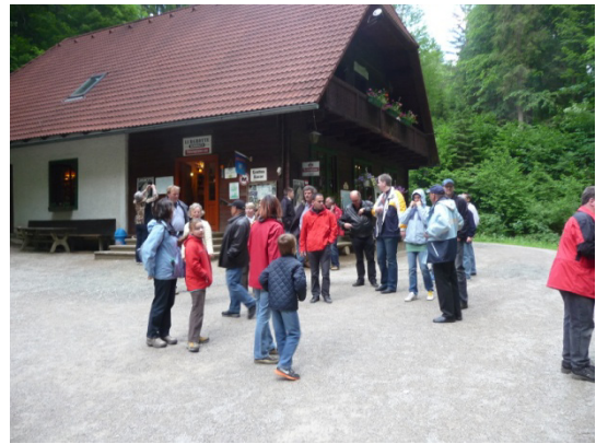
Endlich haben alle eine Eintrittskarte