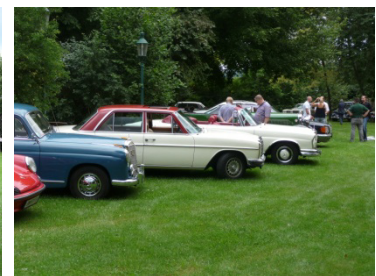
„Le Mans“ Start