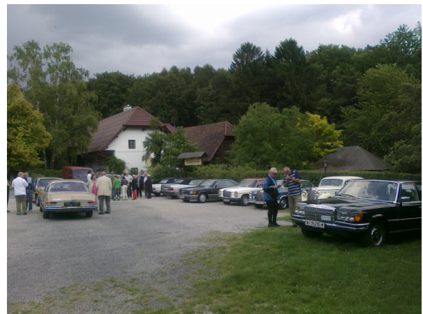
Vor der Waldschenke