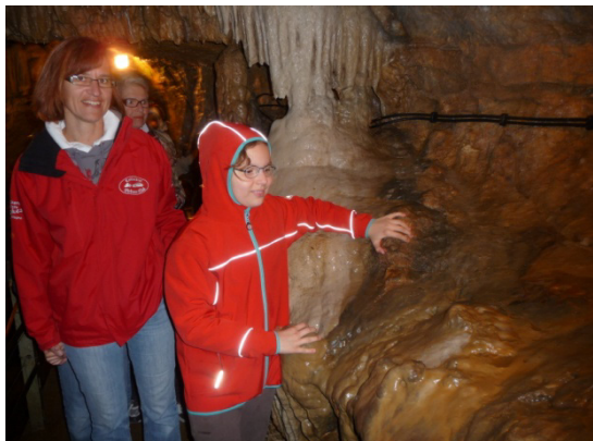
In der Grotte ist es feucht und kühl