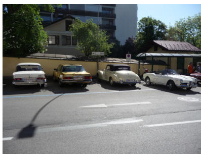
Kurz nach dem Frühstück

Der Morgen des Muttertags begann, wie ein Muttertag sein muss. Bei wunderschönem Wetter und blauem Himmel fuhren wir los.