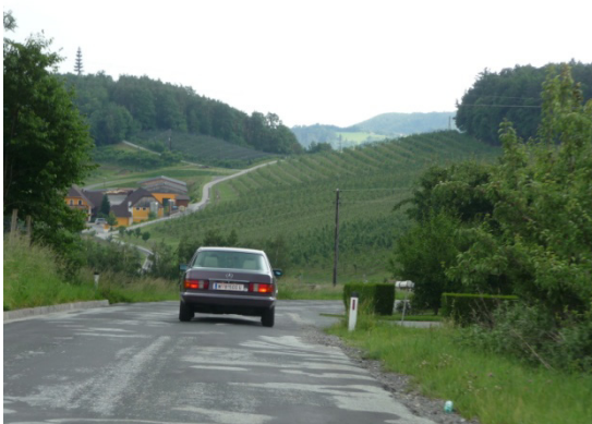
Kurz vor Pöllau