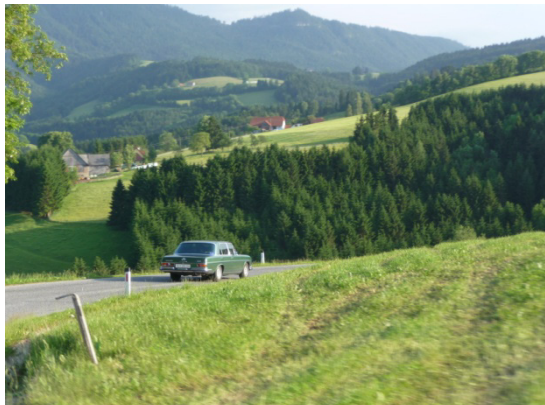
Heinz im 109er

Am Freitag galt es ein Mammutprogramm zu bewältigen. Die erste Fahrt führte eine Gruppe von uns in die Essig und Edelbrand Manufaktur Gölles. Die zweite Gruppe besuchte zur gleichen Zeit das Schokolademuseum der Familie Zotter mit angeschlossenem Tierpark. Im Anschluss hatten wir ein wunderbares Mittagessen im Weingut Thaller. So gestärkt war die anschließende Sonderführung im Mercedes Museum der Familie Kröpfl eine entspannte Nachmittagsgestaltung. Auf dem Weg zum Nachtmahl im Gansrieglhof spülte ein mächtiger Regenguss den Staub von den Straßen rund um die Riegersburg.