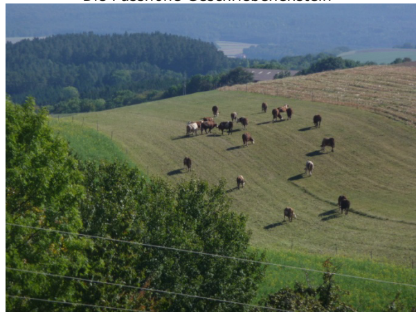
Ein Blick ins hügelige Burgenland