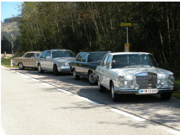
Beim Gasthof Poldi

Um 10:45 ging es den Mariahilfberg (708m) hinab in das Klostertal. Über das Klostertaler Gscheid (764m) und durch das malerische Höllental, erklommen wir das Preiner Gscheid (1.070m) kurz nach 12:00 mittags. Im Gasthof Poldi nahmen wir - meist umringt von Wespen und Motorradfahrern - das mehrgängige Mittagessen auf der sonnigen Terrasse ein. Die Weiterfahrt gegen 14h brachte uns über Mürzsteg und Lahnsattel (1.015m) zum einsam gelegenen Hubertussee im steirisch/NÖ Grenzgebiet.