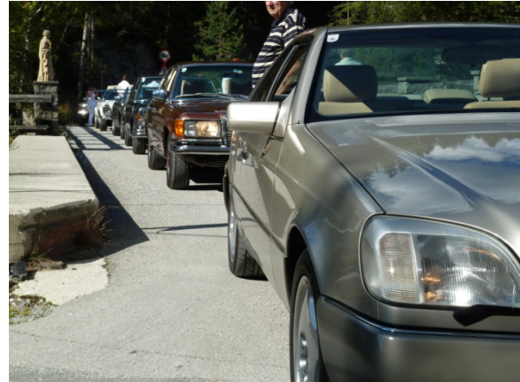
Christian im 140er immer weit vorne

Nach ein paar Fotos auf der Brücke der Wehrabsperzung ging es das Walstertal hinunter nach Mariazell. Mit einem Kaffee in Gußwerk gestärkt, konnte auch das Niederalpl (1.220m) erfolgreich bezwungen werden. Die nur schwach befahrenen Bundes- und Landesstraßen in der Umgebung von Mariazell stellten das "natürliche Terrain" für die Limousinen und Coupes dar, während die "Pässe" eine schöne Abwechslung und Herausforderung für die Cabriolets waren.