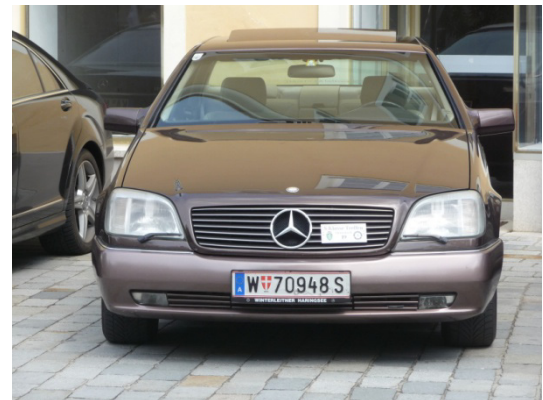
und eines aus Wien