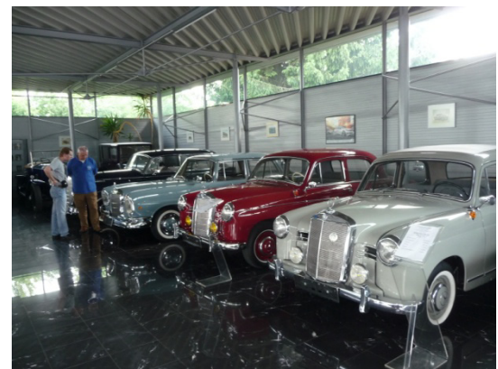
Ein Blick in die obere Halle