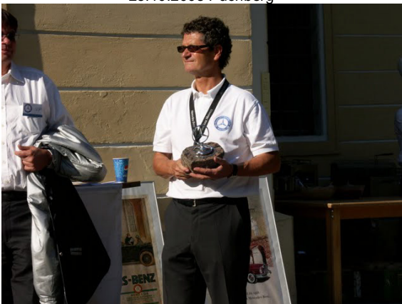
20 Jahre MBVCÖ