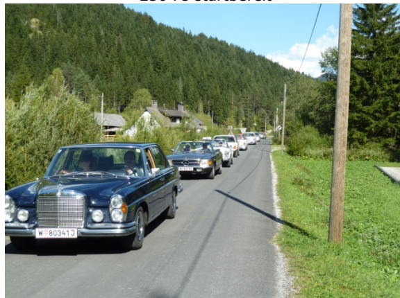
6,3 vor 107, Pagode, 126,....