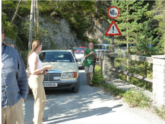
Rast auf der Brücke, etwas weiter hinten