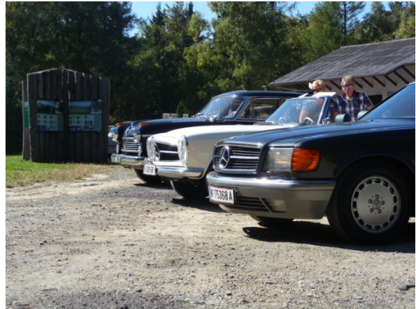
Die Passhöhe Geschriebenenstein