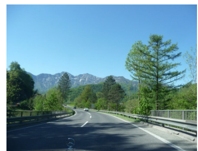
Der Sonne entgegen