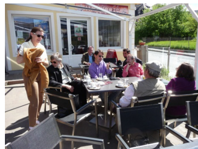
90 Min. nach dem Frühstück