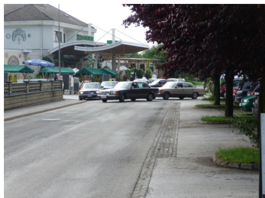
Aufbruch nach Hause