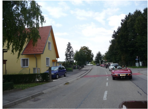
Die Fahrt nach Atzenbrugg

Leider deckte es sich am frühen Nachmittag ein und um 16.00 Uhr begann es zu regnen. Bis dahin genossen wir die gelungene Veranstaltung aber in vollen Zügen.