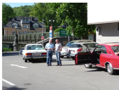
Mit den Freunden aus Graz