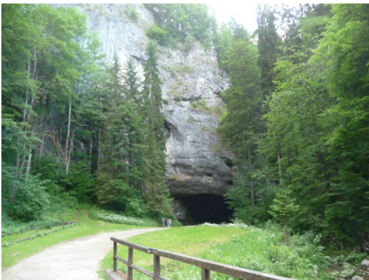
Der Eingang zur Grotte