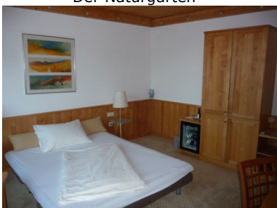
Zimmerausstattung in Massivholz