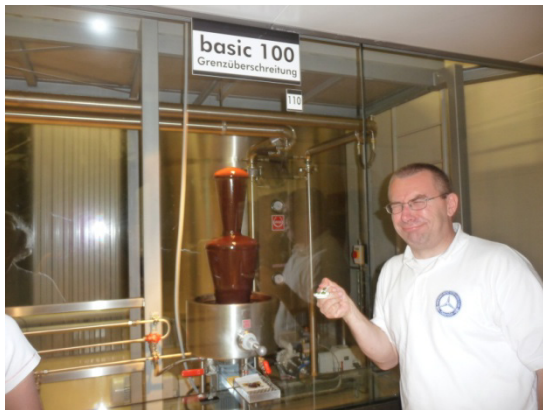
Schokolade ist nicht immer süß