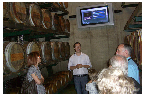
gibt es auch Liköre und Edelbrände