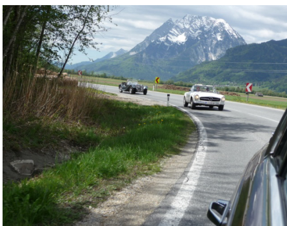
Noch trocken, 100 km bis Lunz am See