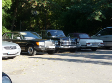
Die Ruhe vor dem Sturm