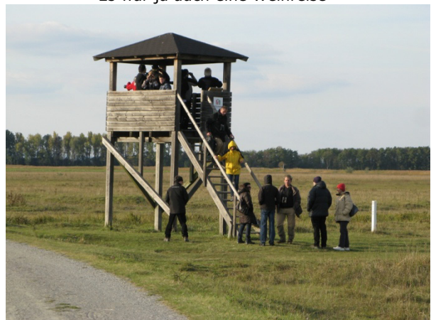
Wer behauptet: „Im Seewinkel gibt's keine Erhöhung“, der lügt!