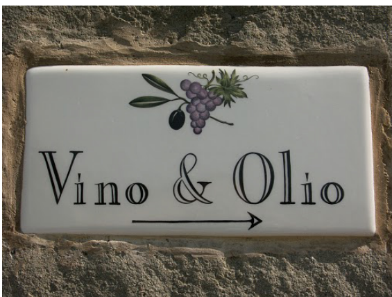
Frei übersetzt: von Vino →

Es wurde aber auch selber gefahren – um die schönsten und besten Weinplätze der Toskana zu erkunden.