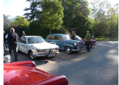
Endlich geht's los