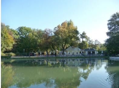
Ein Frühstück mit Seeblick

Am 01. und 02. Oktober hatte es heuer Sommertemperaturen bis 27° C. Das beste Wetter, um unserem geliebten „Altblech“ noch einmal ordentlich die Sporen zu geben. Nach dem gemütlichen Frühstück in Baden ging es gleich mit viel Schwung durchs Helenental.