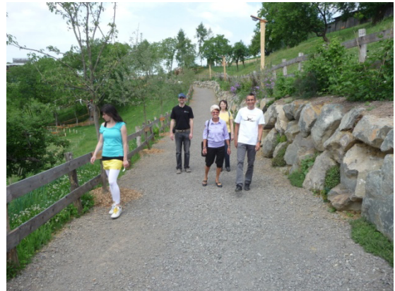
Im Tierpark bei Zotter