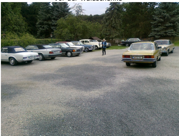
Vor der Waldschenke