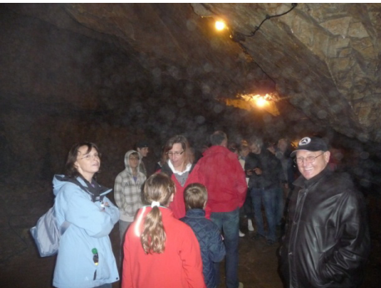
Das tut der guten Laune keinen Abbruch