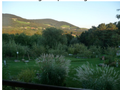
Blick in die andere Richtung