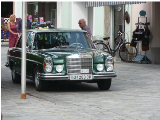
Ein Grazer Schmuckstück