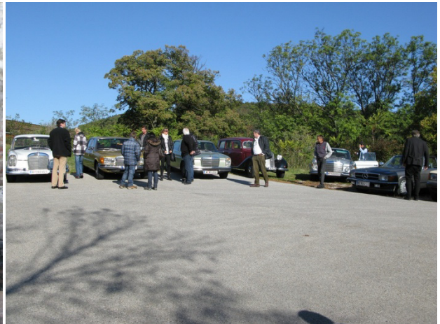
Zeit für ein „Benzingespräch“