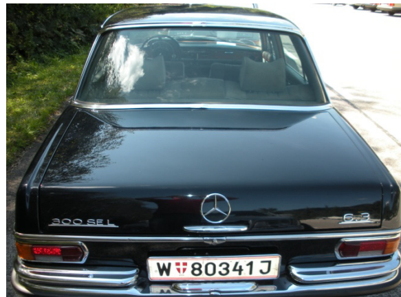
250 Ps startbereit