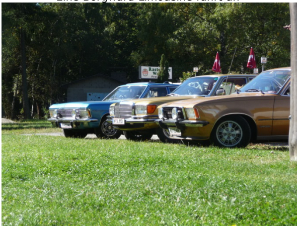
Die Passhöhe Geschriebenenstein