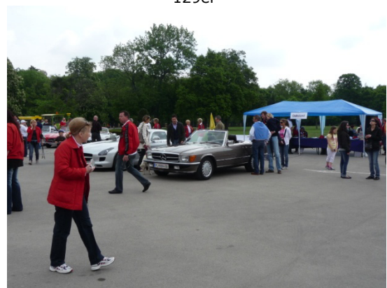
SLS und 107er

Leider begann es mittags zu regnen und die Älteren traten die Flucht an.