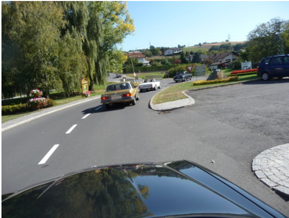
Eine Borgward Limousine führt an

Der Sonntag führte uns vom Pöllauberg ins Burgenland. Der Geschriebenenstein, höchster Berg des Burgenlandes, ließ mit seinen Serpentinaen „Pässefahrer-Hezen“ höherschlagen.