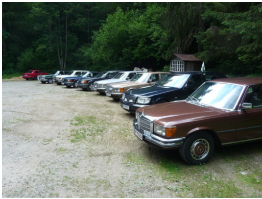
Wir parken vor der Grotte