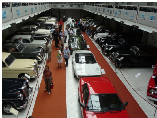
Die große Halle bei Kröpfl