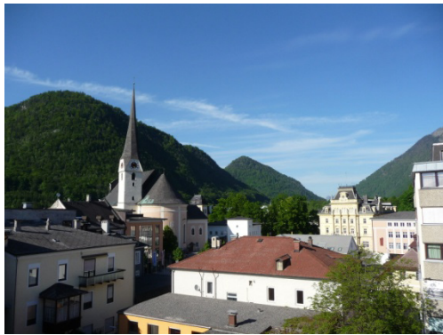
Über den Dächern von Bad Ischl