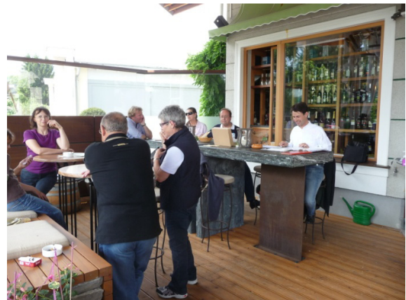
Empfang auf der Terrasse