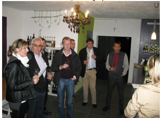
Es war ja auch eine Weinreise