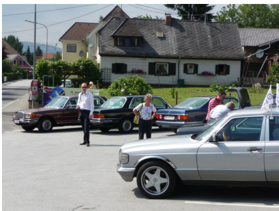
Geschäftiges Treiben vor dem Hotel