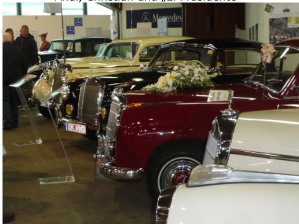
50er und frühe 60er Jahre