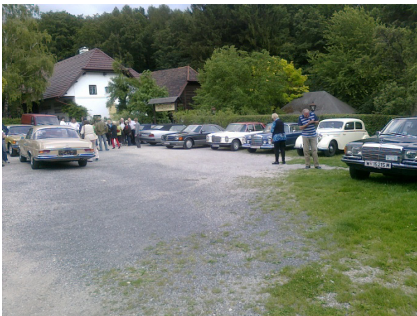
Vor der Waldschenke

Wir schreiben den 01.07.2011, zehn unerschrockene Oldieliebhaber des MBCCÖ bringen ihre Sterne auf Hochglanz. Das erste Halbjahr ist vorbei und diese Tatsache ist für uns Grund genug, die ersten 6 Monate 2011 Revue passieren zu lassen. Um ca. 16.00 Uhr glänzen die Autos und alle setzen sich Richtung Kahlenberg in Bewegung. Treffpunkt 17.00 Uhr. Doch zum wiederholten Male in diesem Jahr meint es Petrus mit uns nicht sehr gut. Um 17.45 Uhr beginnt es heftig zu regnen, und die Temperatur stürzt von 25°C auf 10°C. Nicht alle Teilnehmer haben mit so kühlen Temperaturen gerechnet, und wir verziehen uns in unsere Autos. Die meisten unserer Oldies kühlen zwar an heißen Tagen nicht so gut wie moderne Fahrzeuge, wenn es aber darum geht heiße Luft ins Wageninnere zu blasen, kann modernes Blech unseren Zeugen vergangener Ingenieurskunst nicht das Wasser reichen. Also rollten wir heizend Richtung Waldschenke in Mauerbach. Als wir dort ankamen, empfingen uns appetitlich duftenden Grillhendl, welche sich vor einem riesigen, offenen Kamin drehten. Bei so viel Gemütlichkeit und netter Gesellschaft war das schlechte Wetter schnell vergessen und es wurde ein toller Start ins 2. Halbjahr.