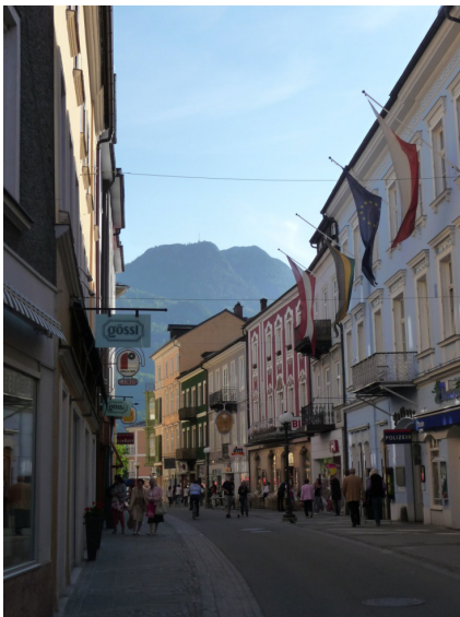
Die Ischler Flaniermeile

Im wunderschönen Ambiente des Goldenen Schiffes in Bad Ischl - einen Steinwurf vom „Zauner“ entfernt - ließen wir es uns, nach einem kleinen Abendspaziergang, beim mehrgängigen Menü gutgehen.