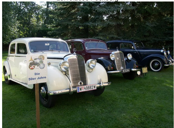
20 Jahre MBVCÖ