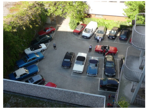
Ein Blick aus der „Alfasuite“

Der Morgen des Muttertags begann, wie ein Muttertag sein muss. Bei wunderschönem Wetter und blauem Himmel fuhren wir los.