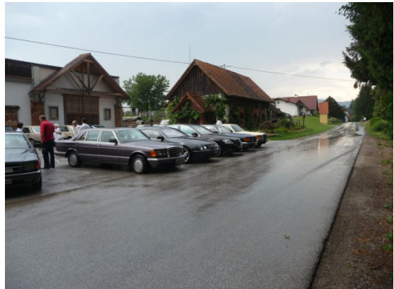
Vor dem Gansriegelhof