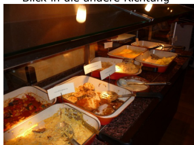
Das Ende der Küchenschlacht