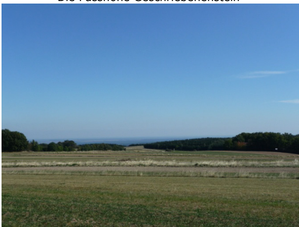
Ein Blick ins flache Burgenland