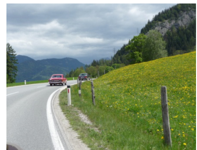
Die Jagd nach dem 126er